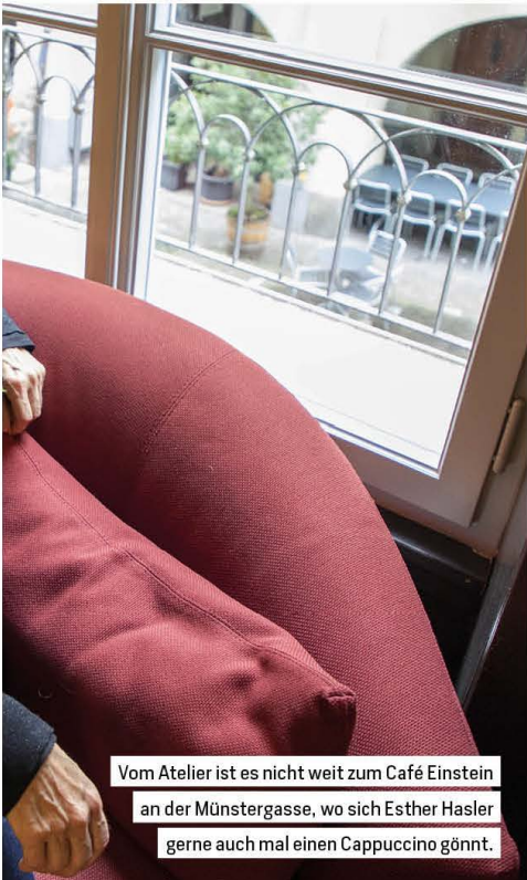
Vom Atelier ist es nicht weit zum Café Einstein an der Münstergasse, wo sich Esther Hasler gerne auch mal einen Cappuccino gönnt.