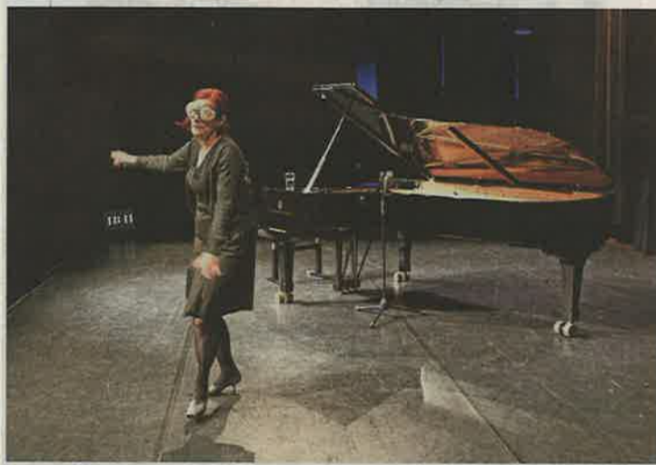
Auf der Bühne die Erlösung: das Publikum reagiert und unterstützt die Künstlerin.